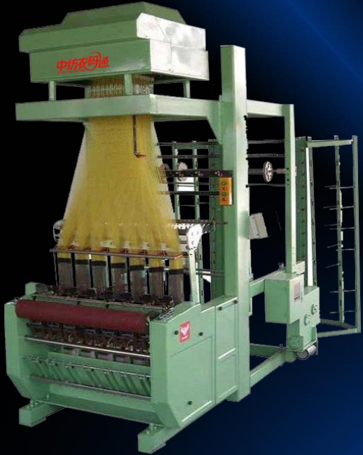
电子提花二维码装备

依托国家工信部立项的《纺织品二维条码标签技术要求》国家行业标准贯标为基础，以中国纺织工业联合会授予的“纺织行业工业互联网平台试点示范”为载体。由地方政府参与多方共同搭建中纺衣码通可追溯服装新体验交易平台。把电子提花二维码作为流量入口，融合移动互联网，不仅解决了印刷吊牌上的二维码不能随衣物和水洗唛编码不能独立的缺陷，替代了传统电子芯片、FRID及印刷技术在纺织行业应用。最终形成以服装企业新品发布、版权维权、数据分析、产品追溯、量身定制、线下体验线上便捷交易售后为一体行业最规范的纺织服装交易平台以及全新的时尚智能制造生态集群。将彻底杜绝纺织品假冒伪劣不良行为，具有里程碑的意义，也是传统纺织服装迈向新一代信息技术革命一次大胆尝试。