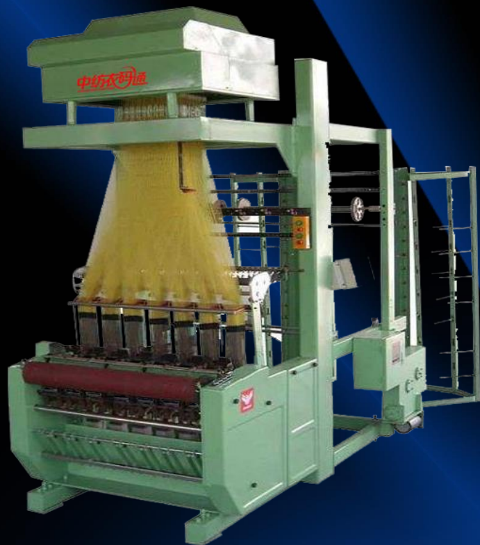
电子提花二维码商标机